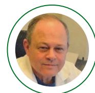
MODERADOR: MIGUEL GARBER